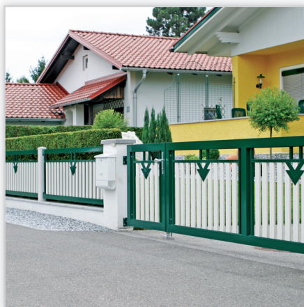
Ogrodzenia posesyjne – model Roma. Konstrukcja: ogrodzenie z lat 60x19 mm z rowkiem dekoracyjnym i sztabek 25x19 mm. Odstęp między latami ok. 100 mm. Ornamenty dekoracyjne dla elementów prostych i pod kątem. Wymiary: na zamówienie.