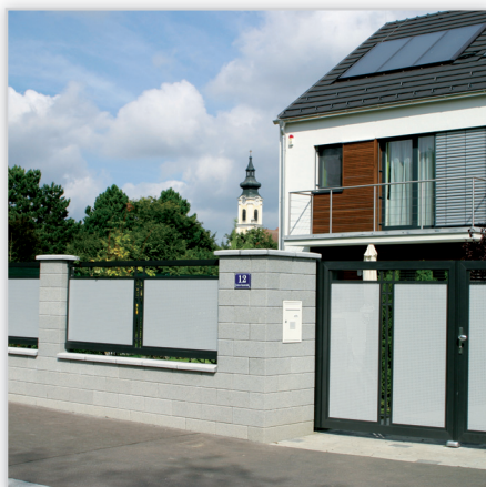
Ogrodzenia posesyjne – model Loskana. Konstrukcja: ogrodzenie ze sztabek 25x25 mm i blachy perforowanej Rv 10-15 o grubości 2 mm. Podział na jedno lub 2 pola blachy. Ornamenty dekoracyjne dla elementów prostych i pod kątem. Wymiary: na zamówienie.