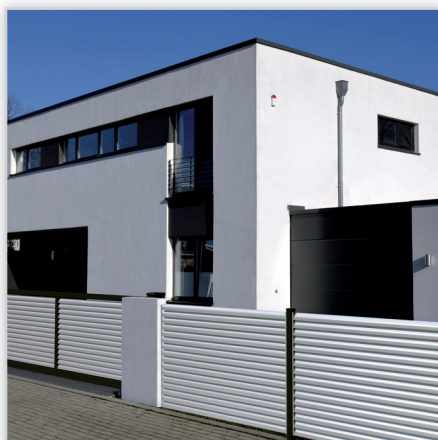
Ogrodzenie posesyjne – model Plissee. Konstrukcja: ogrodzenie z poziomych lameli, osadzonych w pionowych profilach H. Wypełnienie standardowe nieprzejrzyste, jednak możliwe jest zwiększenie odstępów. Wymiary: maksymalna szerokość 2200 mm.