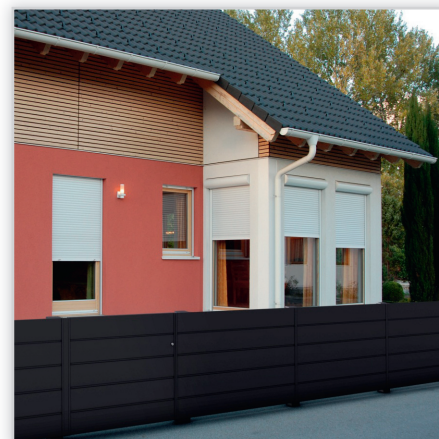
Ogrodzenie posesyjne – model Vista. Konstrukcja: ogrodzenie nieprzejrzyste z poziomych lat 200x19 mm lub 150x19 mm połączonych profilami 15x15 mm, słupy i śruby niewidoczne od zewnątrz. Wykończenie: lakierowane proszkowo. Wymiary: maksymalna szerokość przęsła 2200 mm, stałe wysokości wynikające z braku możliwości przycinania lat, oraz regulacji odstępów pomiędzy nimi.