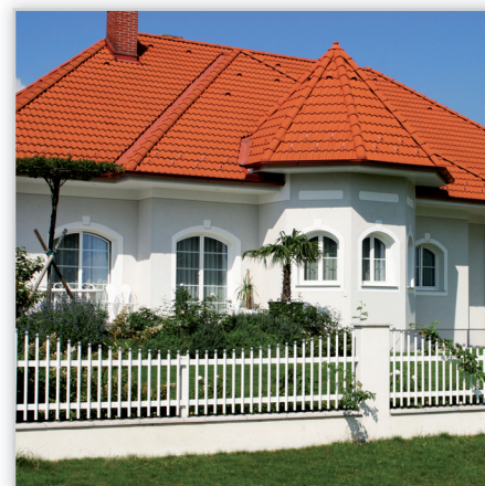
Ogrodzenie posesyjne – Gloriette. Konstrukcja: ogrodzenie z pionowych palisadek o przekroju \varnothing 30 mm. Wykończenie: lakierowane proszkowo, odstęp między palisadkami ok. 75 mm, wykończenie w postaci cebulek, kulek, wieżyczek i lili. Standardowy kształt górnej krawędzi prosty. Wymiary: na zamówienie.