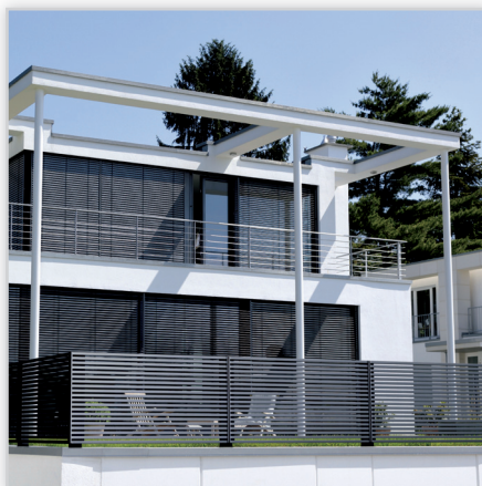
Ogrodzenia posesyjne – model Linea. Konstrukcja: ogrodzenie z poziomych profili o przekroju 40x30 mm, z niewidocznymi od zewnątrz słupami i śrubami. Wykończenie: lakierowane proszkowo. Wymiary: maksymalna szerokość przęsła 2200 mm.