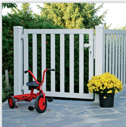
Ogrodzenia posesyjne – model Modena. Konstrukcja: ogrodzenie z pionowych lat 60x19 mm z rowkiem dekoracyjnym. Odstęp między latami ok. 100 mm. Możliwe warianty z blachą perforowaną Rv 10-15. Wymiary: na zamówienie.