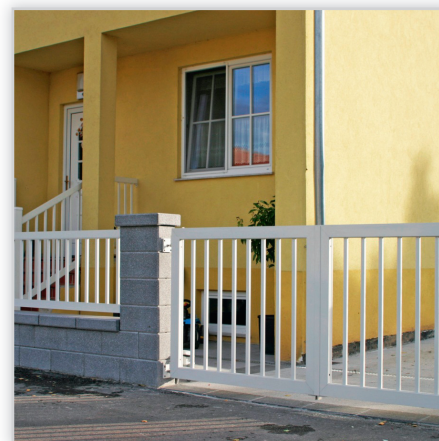
Ogrodzenia posesyjne – model Siena. Konstrukcja: ogrodzenie z pionowych profili 25x19 mm z rowkiem dekoracyjnym. Odstęp między sztabkami ok. 100 mm. Ornamenty dekoracyjne dla elementów prostych i pod kątem. Wymiary: na zamówienie.